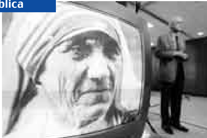
Prvou nositeľkou Templetonovej ceny bola matka Tereza z Kalkaty. V pozadí Charles Taylor.

V tomto smere bola ladená aj jeho známa mariánska prednáška v roku 1997 v Daytone (Ohio), kde vyhlásil, že katolícka cirkev by si mohla nájsť miesto v modernom svete, keby pochopila západnú modernosť ako jednu z mnohých civilizácií, v ktorých sa káže a praktizuje kresťanstvo. Zabránilo